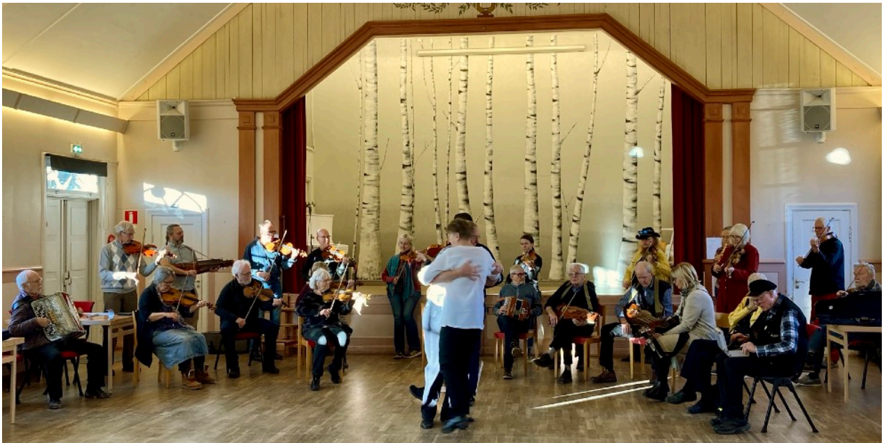
ALLSPEL MED DANSVÄNLIGA LÅTAR

Noter och ljudfiler finns på gilletts hemsida www.vsg.se