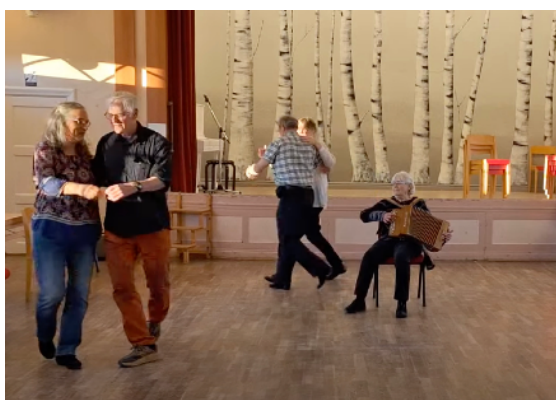
GERD HÅLLER TAKTEN