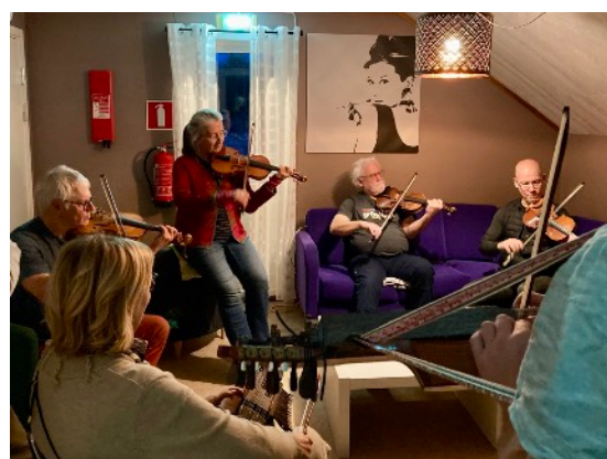
BUSKSPEL EN TRAPPA UPP